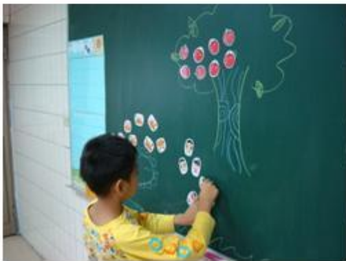
依題意內容排出圖片數量及位置