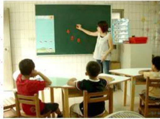
專注力訓練，仔細看黑板所呈現的 數字及位置並回答相關問題