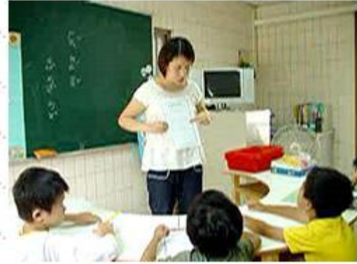
揭示社會技巧團體應遵守之約定