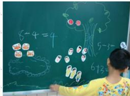
依題意寫出加減法算式並運算