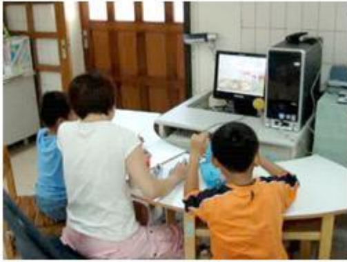
資訊融入教學，閱讀故事 PowerPoint並回答相關問題