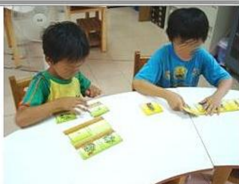
依圖卡內容排出正確順序