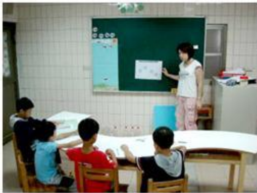
低年級學生進行「專心看、畫重點」練習。