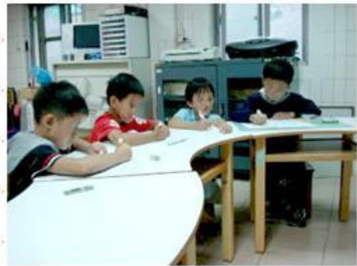
孩子們專注練習，依指令完成學習單。