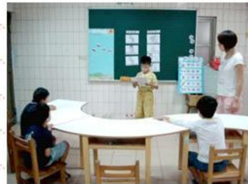
學生上台演練自我介紹，台下學生專注聆聽