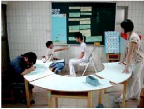
學生上台演練，分別扮演訪問者與受訪者，演練過程需配合傾聽與詢問相關技巧。