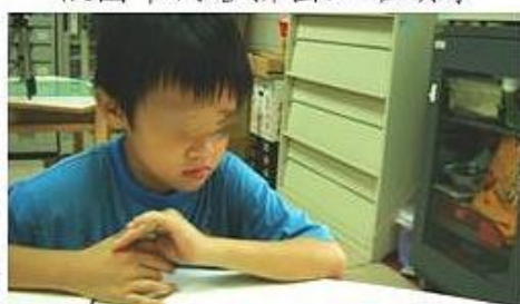
練習以完整語句說出圖片故事