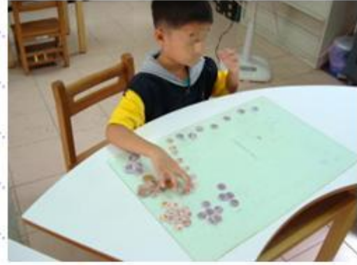
操作錢幣教具學習錢幣的組合與兌換