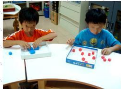
利用積木學習加法與減法