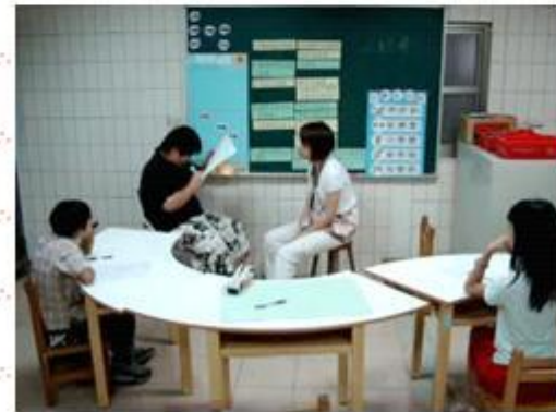
學生上台扮演小記者訪問老師，演練過程需配合傾聽與詢問相關技巧