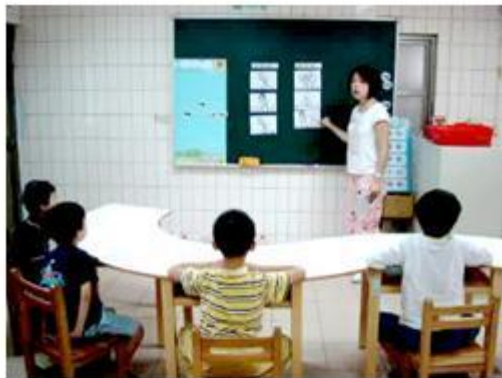
說明傾聽與發言相關技巧