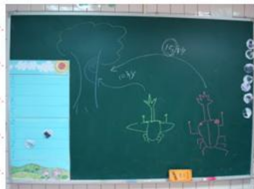
專注力訓練，以「鋸形蟲爬樹」讓 學生練習專注讀秒