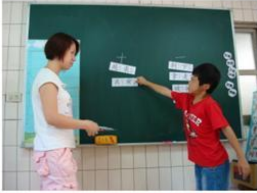
以關鍵字字卡，學習判斷加減法應用題題意