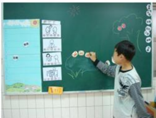
專注力訓練，依老師所描述之故 事內容正確擺放圖片位置