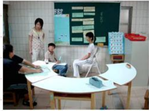
台下傾聽者給予台上演練者回饋，教師亦針對演練表現給予正負向回饋。