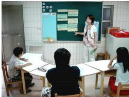
說明傾聽與詢問相關技巧