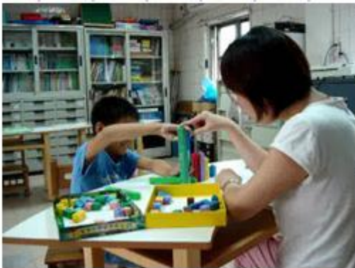
利用積木學習「分與合」的概念

針對數學基礎概念差、題意理解困難、邏輯推理與抽象思考能力欠佳之學生，安排相關數學學習活動，透過具體操作教具、數學遊戲學習、引導讀題、反覆練習等方式學習，以達到提升數學能力的目的。