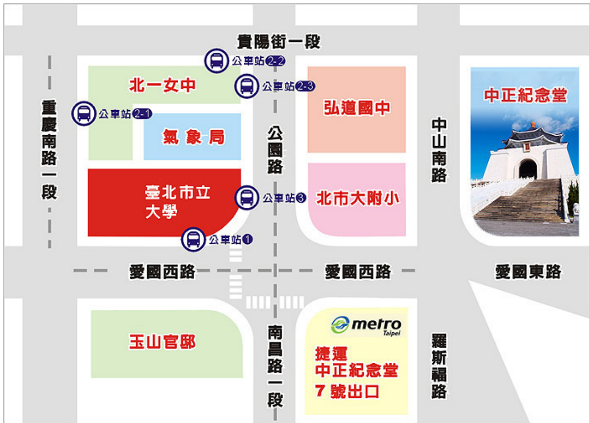
臺北市立大學（博愛校區）校園平面圖